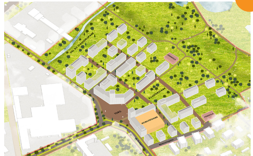
↑ En inledande planeringsetapp är den kommunägda fastigheten i östra Pappersbruksområdet.